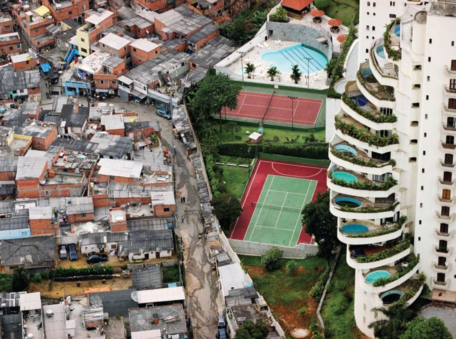
"מורומבי" - שכונת יוקרה הגובלת בשכונת העוני "פראיספוליס", סאן-פאולו, ברזיל

אקו מוצא קווים דומים בין העיר בת ימינו לערי ימי הביניים. אולם הגיוון אין פירושו בהכרח סובלנות ורב־תרבותיות. בערים רבות באירופה הולך ומחריף הקונפליקט בין המהגרים לוותיקים. הוותיקים רוצים לשמר את הזהות הלאומית ואילו המהגרים שהשתקעו בעיר תובעים זכויות אזרח. במיוחד מתחדד העימות בין ותיקים למהגרים בערים גדולות ומעורבות. הוויכוח מעורר דיון בסוגיות של לאומיות, אזרחות ורב־תרבותיות. מדינת הלאום האירופית מתמודדת עם דילמה קשה. כדי לשמור על רמת החיים היא נזקקת למהגרים ולכוח העבודה הזר והזול. מצד שני, התושבים הוותיקים רוצים לשמור על הזהות והתרבות הלאומית. התלות והניכור מגבירים את שנאת הזר ואת האלמנטים הגזעניים והלאומניים.