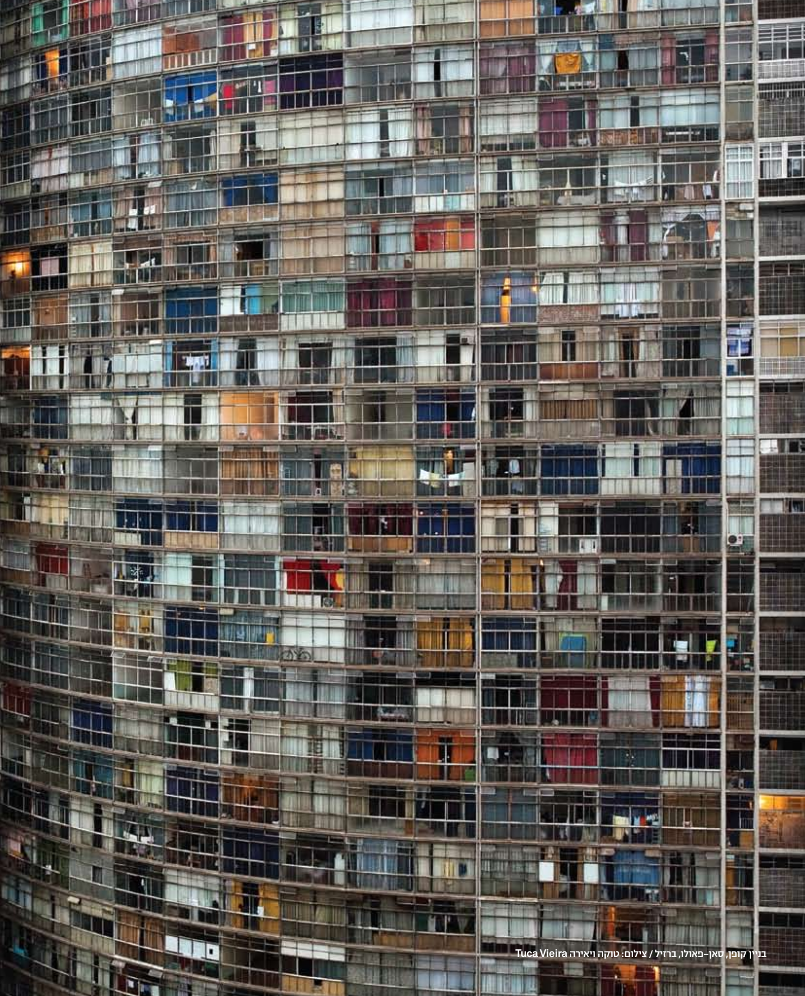
בניין קופן, סאן-פאולו, ברזיל